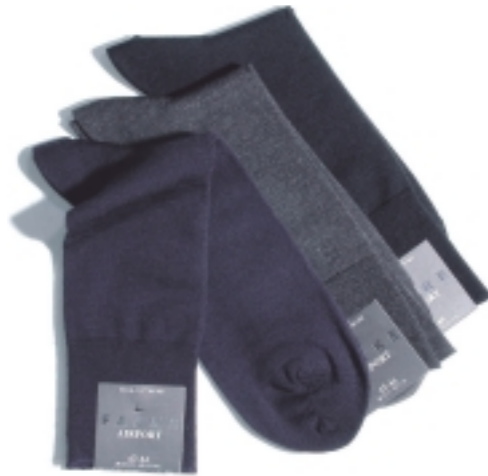
Beispiel für eine Sockenauswahl: Qualitätsware von Falke