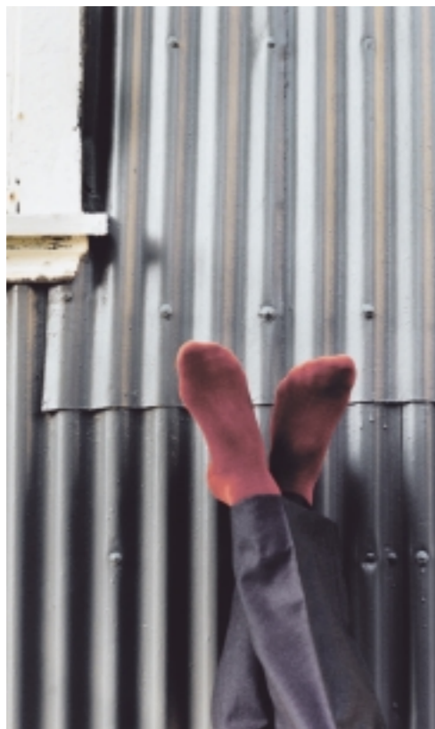
Das Socken-Abo von getsox – Damit können Sie die Füße hochlegen

und Strümpfe ausgesucht. Die Falke-Gruppe steht seit ihrer Gründung vor über 100 Jahren für höchste Qualität, Innovation und zeitlose Modernität. Getsox-Kunden finden ihren ersten Eindruck einer professionellen Website somit durch ein hervorragendes Markenprodukt und eine einwandfrei funktionierende Logistik bestätigt. So kann sich Montgelas um das kümmern, was letztendlich über den Erfolg von Getsox entscheidet: Kundenservice, Vermarktung und PR.